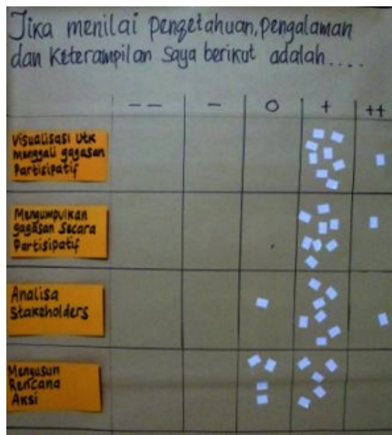
Result of Post - Test