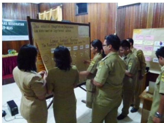
Peserta mengisi lembar kepuasan peserta