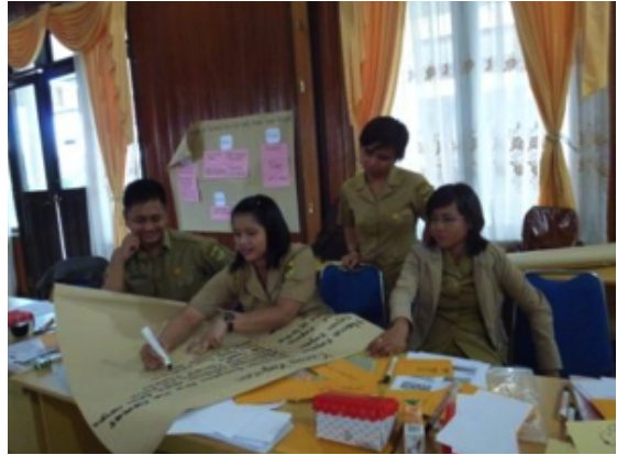
Kelompok 1 & 2 berdiskusi tentang acara yang akan disimulasikan menggunakan metode dan alat VIPP