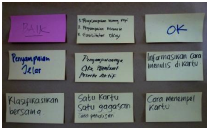
Hasil umpan balik dari peserta dan fasilitator