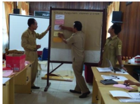
Kelompok 1 & 2 mempresentasikan bagaimana VIPP dapat digunakan di dinas kesehatan

Umpan balik meliputi bagaimana menggunakan warna kartu secara efektif. Semua peserta menikmati sesi ini dan mereka memberikan beberapa umpan balik setelah masing-masing kelompok menyampaikan presentasi mereka dalam bentuk visualisasi.