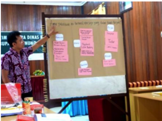
Dino menjelaskan cara mengelompokkan gagasan

Tata tertib pelatihan dibuat secara partisipatif dengan meminta peserta menuliskan di kartu berdasarkan ide mereka masing-masing. Kemudian ide mereka ditempelkan di kertas plano dan dibuat secara cluster setelah seluruhnya didiskusikan dan disepakati oleh seluruh peserta. Penjelasan juga diberikan bahwa ini juga merupakan salah satu contoh kegiatan untuk mengumpulkan gagasan secara partisipatif.