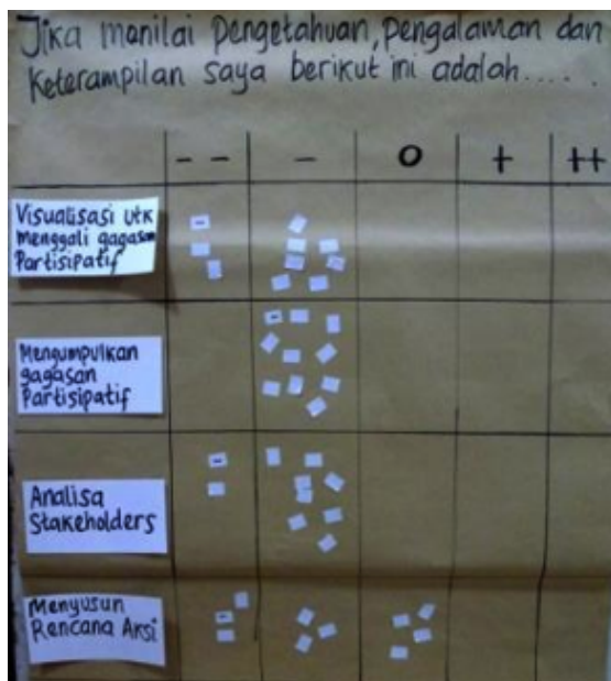
Result of Pre - Test