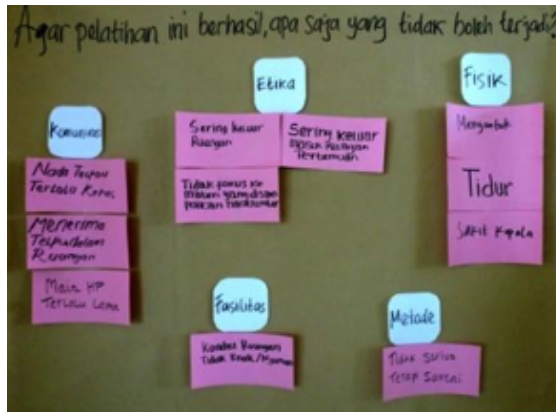
Hasil dari pengelompokan gagasan