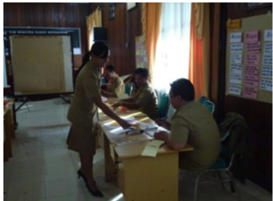
Kelompok 1 & 2 sedang mensimulasikan penggunaan VIPP di acara mereka