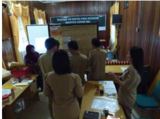
Peserta sedang mengisi kolom pre-test yang disediakan