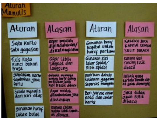
Aturan visualisasi dan alasannya