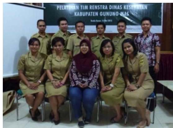
Seluruh peserta dan fasilitator